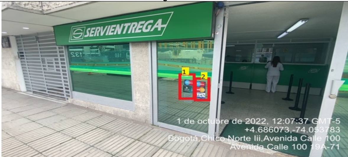
Fotografía No. 3

En la cual se evidencian dos (2) elementos PEV identificados con los números 1 y 2, pertenecientes al establecimiento comercial denominado SERVIENTREGA S A, los cuales se encuentran incorporados en las ventanas de la edificación.